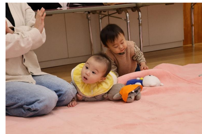
1月の寒い中、今日は、3組の親子が来園！！ パパ・ママと一緒に赤ちゃんたちも、心も体もポッカポカ