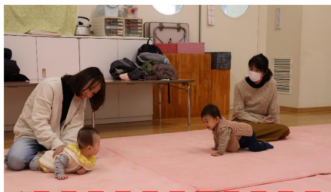
赤ちゃん同士も、あけまして おめでとう♡