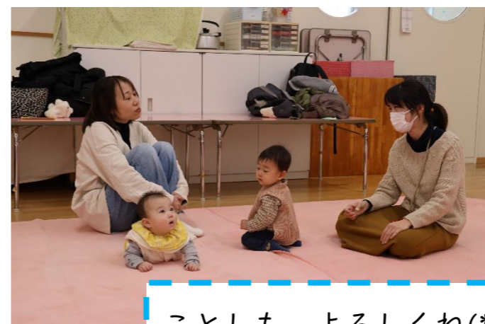
ことしも、よろしくね(*^▽^*)