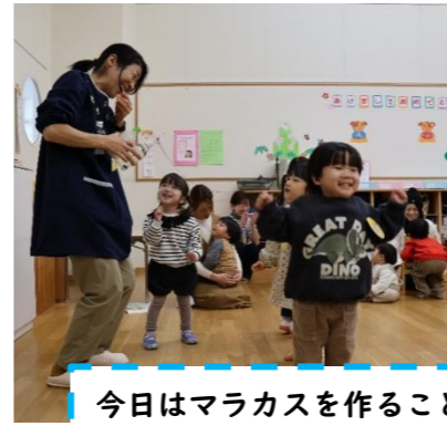
今日はマラカスを作ることを知って「イエ〜エイ」大喜び★