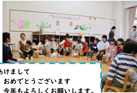
あけまして おめでとうございます 今年もよろしくお祈りします。