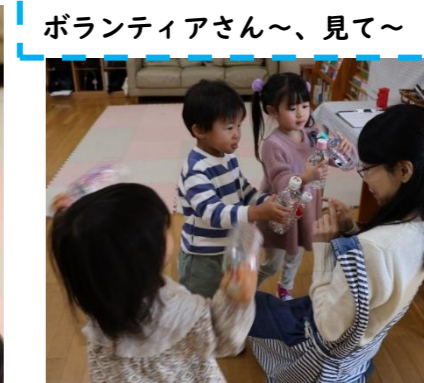
ボランティアさん〜、見て〜