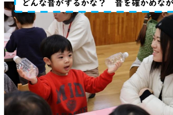
どんな音がするかな？ 音を確認しながら楽しんで作ったね