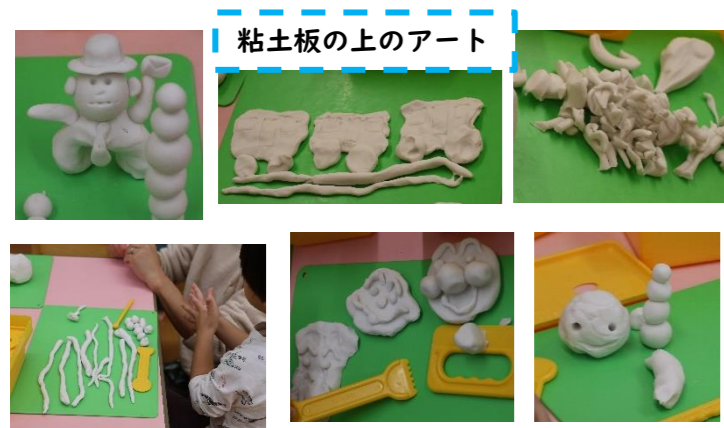
粘土板の上のアート