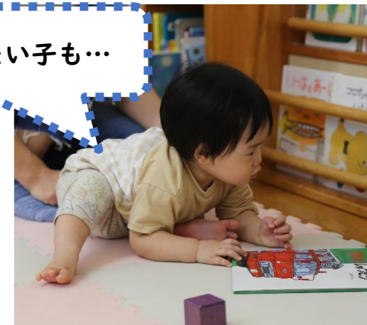
寝転ぶより動きたい子も…