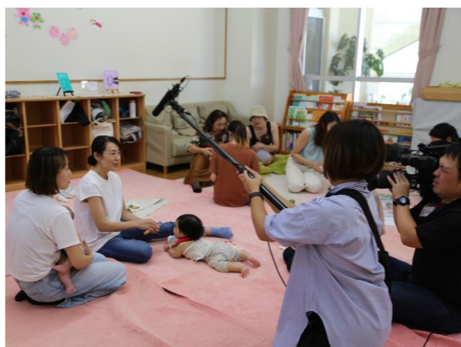
この日は、TSS テレビの取材が入りました。