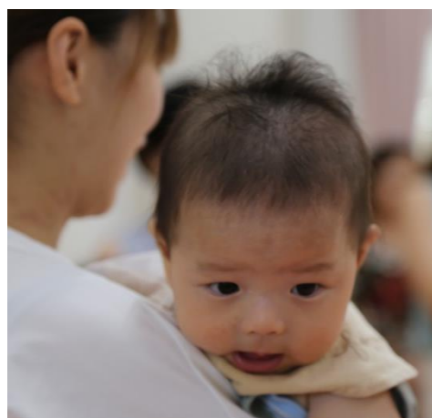
今日も Happy Healthy いっぱい