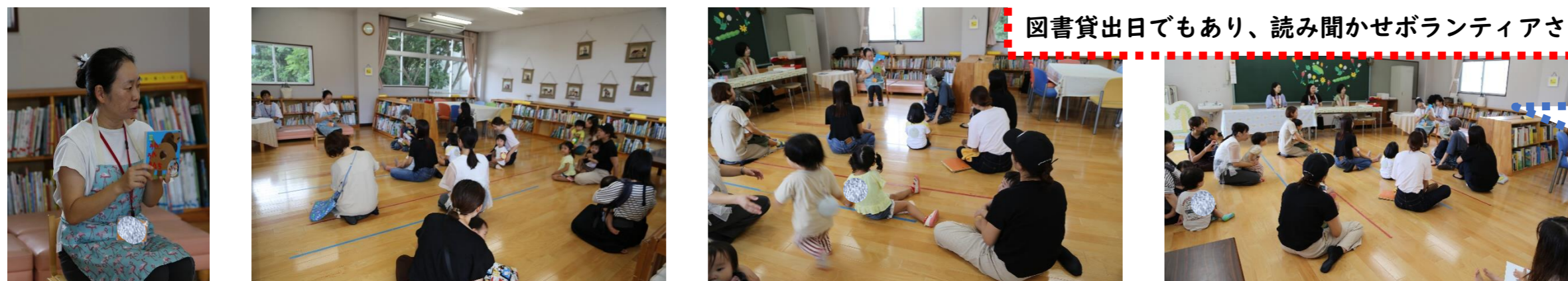
図書貸出日でもあり、読み聞かせボランティアさんが絵本をセレクト