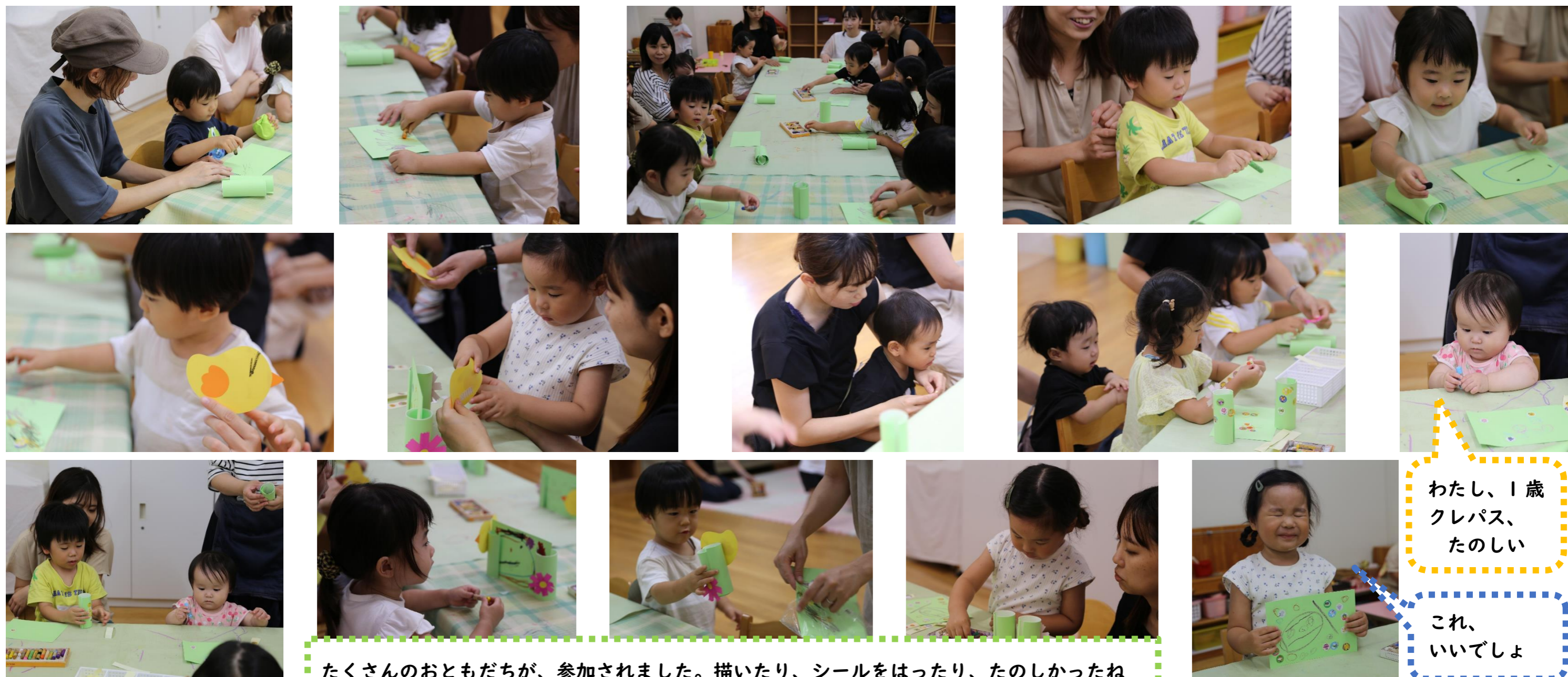
たくさんのおともだちが、参加されました。描いたり、シールをはったり、たのしかったね