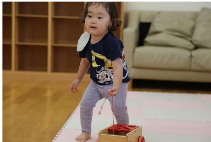
同じ教室に子どもが集うと、人のしていることが気になる…