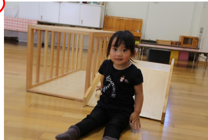
一人がすべり台をすると、もう一人も同じようにすべり台に…