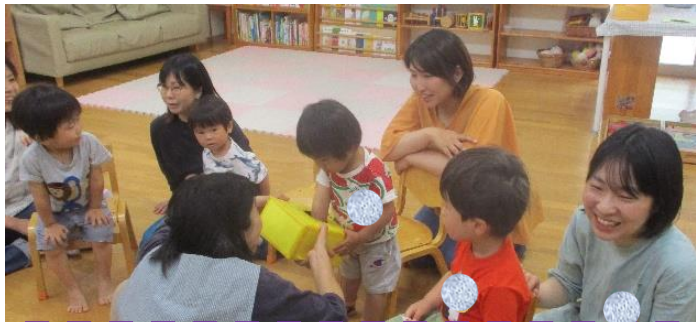
集いのくじ引き、みんな大好き♡ 今日の席はどこになるかな？