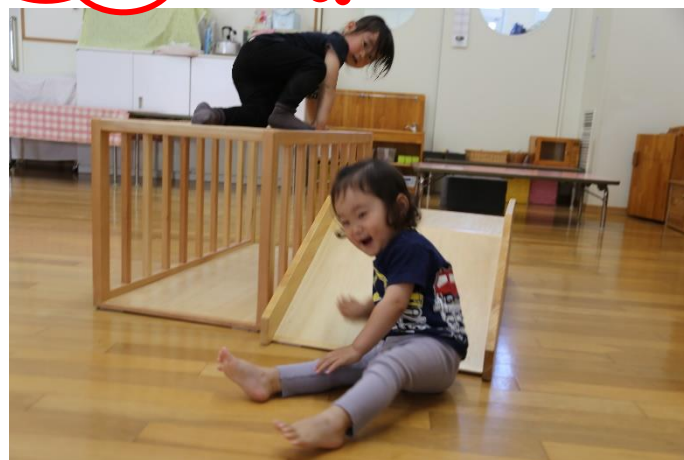
上に登っているお友だちの様子を