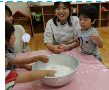
← 出来上がりの小麦粉粘土、ふにふに。 ↓サラサラの小麦粉から、粘土作りはじまり～